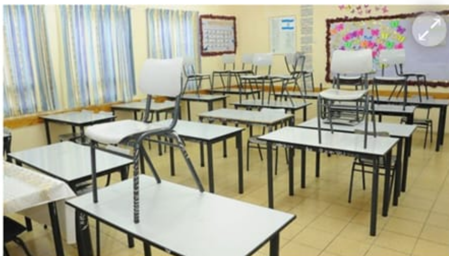
כיתה בבית ספר תיכון